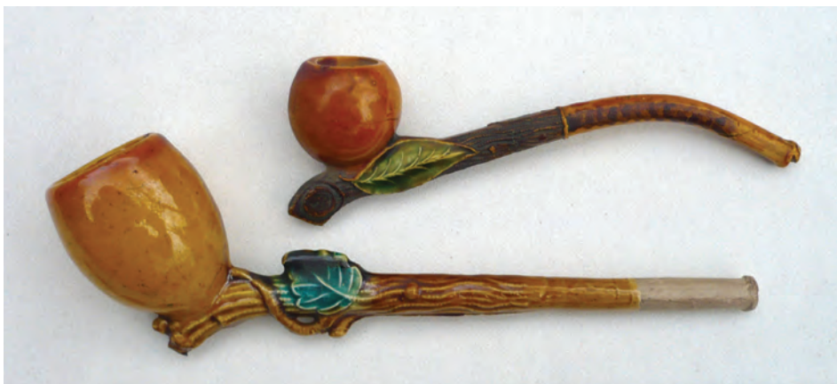
Afb. 9. Nog twee voorbeelden van de bonte Belgische smaak. Wingender Frères te Chokier. Laatste kwart 19e eeuw. (Collectie auteur, foto: Ron de Haan)

Opgegraven steelfragmenten laten zien dat Barth ook voor bepaalde firma's pijpen in opdracht vervaardigde. Zo komen op deze fragmenten voor: Johnson/Glasgow en Johnson/model 19. 13 Daarnaast had hij de meer algemene internationale modellen zoals de TD pijp en de Jean Nicot pijp in zijn assortiment. 14 Voor de eigen markt produceert Barth o.a. een Leopold I en bedevaartspijpen voor Notre-Dame de Walcourt. 15 Van geen van de andere Belgische pijpenmakers zijn modellen voor specifieke exportmarkten bekend. Het is opvallend dat het juist het grootste Belgische bedrijf is dat speciale pijpen voor deelmarkten uitbrengt. Kennelijk kon in dit bedrijf daarvoor de benodigde flexibiliteit worden op-