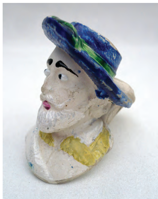
Afb. 12. . Imitatie van de Rubens pijp van Gambier (nr. 436) door Jean Knoedgen uit Bree. Laatste kwart 19e eeuw. (Collectie auteur)