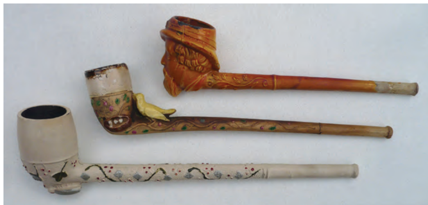
Afb. 4. De Belgische bonte smaak die in het buitenland niet werd gewaardeerd. Wingender Frères uit Chokier. Laatste kwart 19e eeuw.