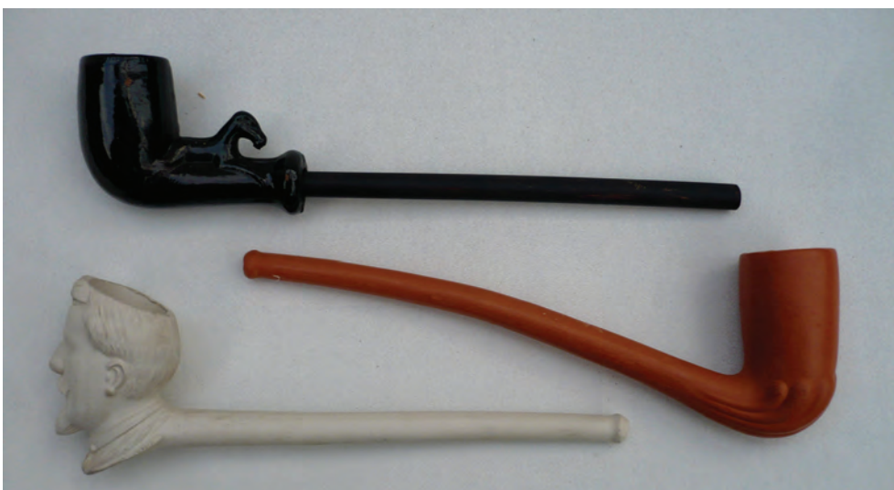
Afb. 8. Pijpen van De Bevere uit Kortrijk. Begin 20e eeuw. (Collectie auteur)