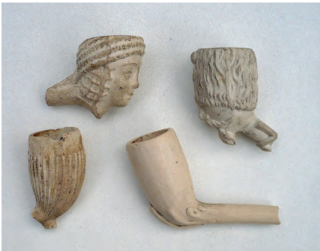
Afb. 2. Opgegraven pijpen met eenvoudige modellen (onder) die geschikt waren voor de export via grote handelshuizen. Desiré Barth, Andenelle. Tweede helft 19e eeuw.