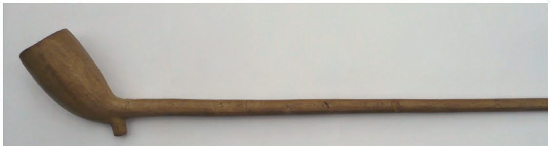
Afb. 7. Pijp waarmee aansluiting werd gezocht bij het Nederlandse product. Wingender frères uit Chokier. Laatste kwart 19e eeuw. (Collectie auteur, foto: Ron de Haan)