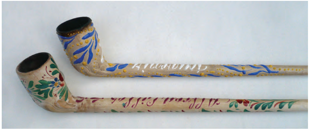
Afb. 5. Twee groot formaat naampijpen van Nihoul en Scouflaire uit Nimy. Deze firma's exporteerden ook naar Noord-Frankrijk. Derde kwart 19e eeuw. (Collectie auteur, foto: Ron de Haan)