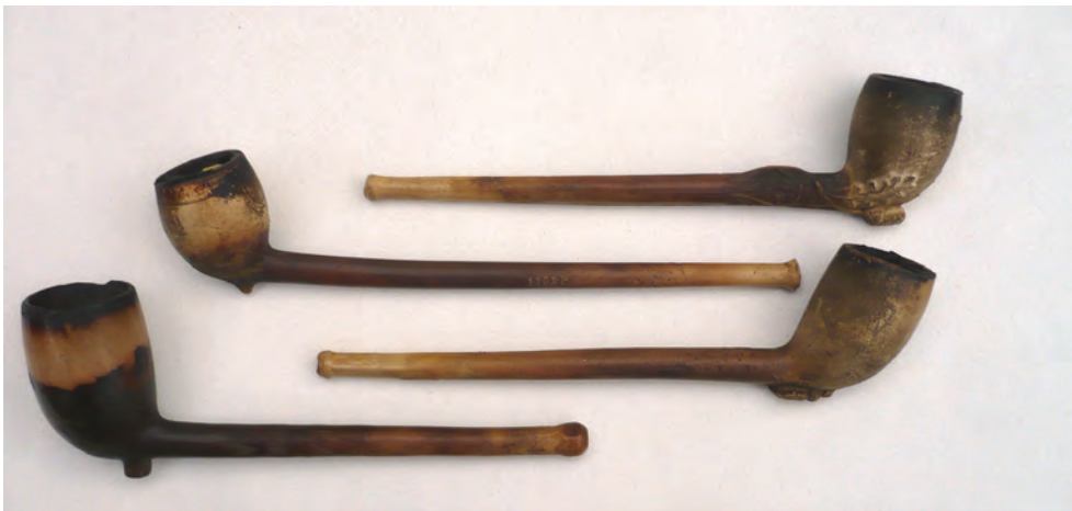
Afb. 6. Eenvoudige pijpen geschikt voor de export via grote handelshuizen. Laatste kwart 19e eeuw.