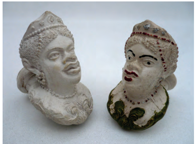
Afb. 3. De vrouw van de krankzinnige dictator van Haïti, Adélina Soulouque-Lévêque. Links versie van Gambier (cat. nr. 582) en rechts de pijp van Wingender frères uit Chokier. Laatste kwart 19e eeuw. (Collectie auteur,)